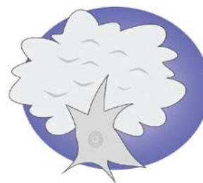
vzťah k životnému prostrediu