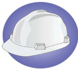
bezpečnosť pri práci